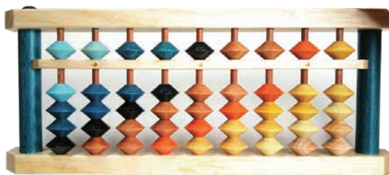
※サンプル画像です。