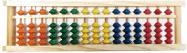
※サンプル画像です。